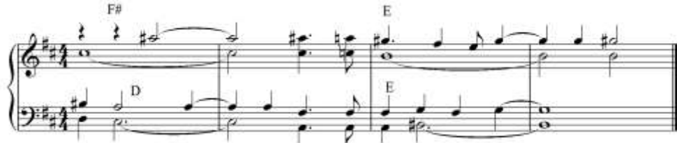
شكل رقم (١٥)