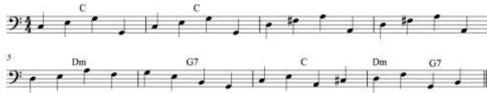
شكل رقم (١٨) تمرين للتآلفات التي تؤدي أسفل اللحن الأساسي