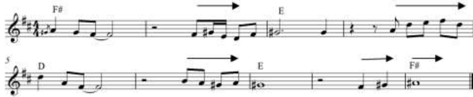
شكل رقم (١٦) تمرين يستخدم نغمات تؤدي من تألف لآخر

المقطوعة الرابعة بعنوان : قطار الارتجال ( ١١ - ٦٩ )