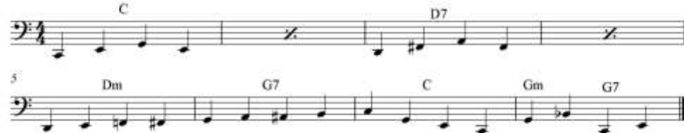
شكل رقم (١٩) تمرين مقترح للباص المتحرك Walking Bass